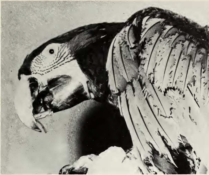
Abb. 5: Aufstellen des Hölzchens zur Reinigung des Unterschnabels

Schließlich benutzte das ♂ auch Blumendraht zum Reinigen des Schnabels. Beide nahmen auch ebenso wie die Kubaamazone und Hyazintharas oft etwas Rinde oder Blätter, die sie mit dem Unterschnabel knabbernd gegen die Feilkerben drückten.